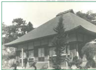
下田の玉泉寺 Gyokusenji Temple, Shimoda

幕府とハリスは日米修好通商条約に調印。この条約により米国外交使節の江戸駐在や、函館のほか、神奈川、新潟、兵庫、長崎の4港の開港が定められる。(下田は閉港)