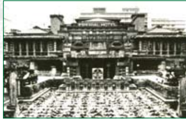
米国大使館の仮事務所があった旧帝国ホテル Old Imperial Hotel

旧帝国ホテルは、フランク・ロイド・ライト(Frank Lloyd Wright)によって設計されたもので、場所は東京市麹町区内幸町(現 東京都千代田区)にあった。