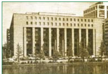
GHQがあった旧第一生命ビル Old Dai-ichi Mutual Life Insurance Building

8月15日、日本降伏。戦後直ちにアメリカ、イギリス、フランス、ソ連などを中心とした連合軍による日本占領が始まり、連合軍最高司令官総司令部(GHQ)が東京の旧第一生命ビル(写真)に置かれた。GHQのダグラス・マッカーサー(Douglas MacArthur)元帥は、大使公邸を住まいとした。