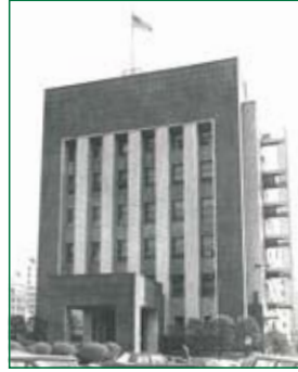
別館として使われた南満州鉄道ビル South Manchurian Railways Company building

大使館再開。それまでの大使館本館（現在の場所）に加え、すぐ近くの南満州鉄道株式会社の建物（港区赤坂葵町2番地）を購入し、大使館別館として使用。本館には大使の執務室、政治部、軍事関係の部署、別館には領事部や広報部、調達調整委員会などがあった。別館は1973年に三井不動産に売却され、1977年に引き渡された。