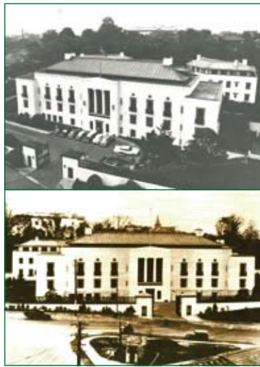
1931年当時の旧米国大使館 Old U.S. Embassy in 1931