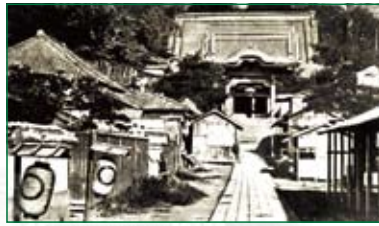
麻布の善福寺 Zempukuji Temple, Azabu

1月19日、ハリスは弁理公使に任命される。7月、ハリスは下田より江戸に入り、幕府より貸与された麻布の善福寺に公使館と住居を移す。写真は麻布善福寺。(現東京都港区元麻布1-6-21)7月1日、横浜開港。7月4日、横浜の本覺寺に領事館が開かれる。(現神奈川県横浜市神奈川区高島台1-2)