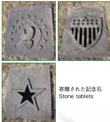
寄贈された記念石 Stone tablets