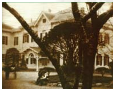
赤坂にあった旧米国公使館 Old American Legation in Akasaka