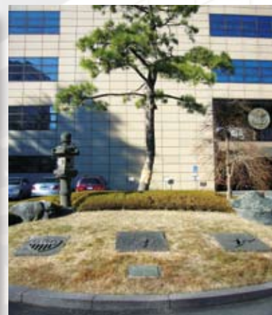
築地居留地跡にあった記念石 Stone tablets from Tsukiji foreign settlement