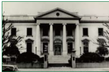
旧横浜米国領事館 Old U.S. Consulate building in Yokohama

1932年に建設された横浜の領事館は1973年に東京の米国大使館領事部に併合された。写真は横浜市中区山下町6番地にあった米国領事館の建物の様子。設計はJ・H・モルガン(J.H. Morgan) 建築設計事務所、施工は竹中工務店による。